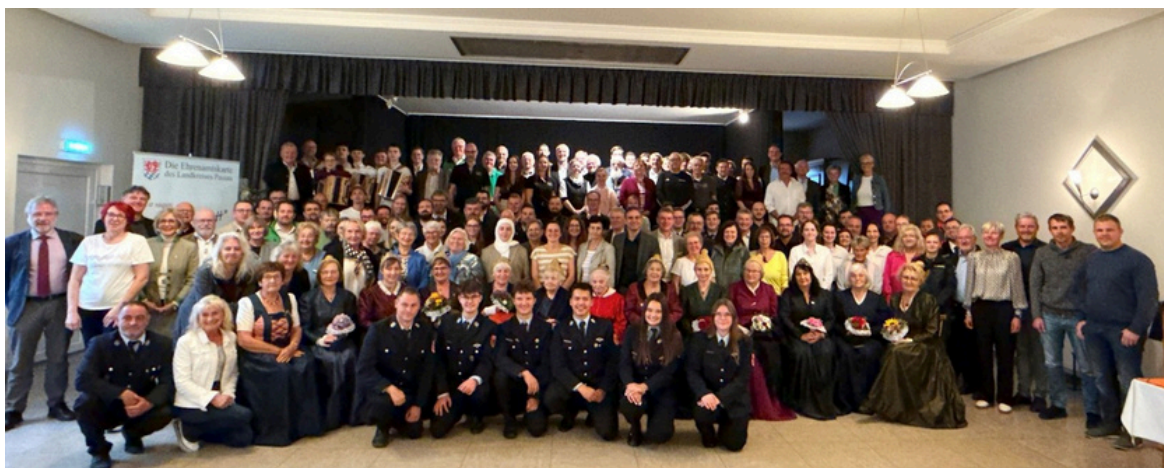
Gruppenfoto der anwesenden Gäste beim Ehrenamtsfrühschoppen

Anschließend ließ man die Veranstaltungen bei einem gemeinsamen Weißwurstfrühschoppen gemütlich ausklingen.