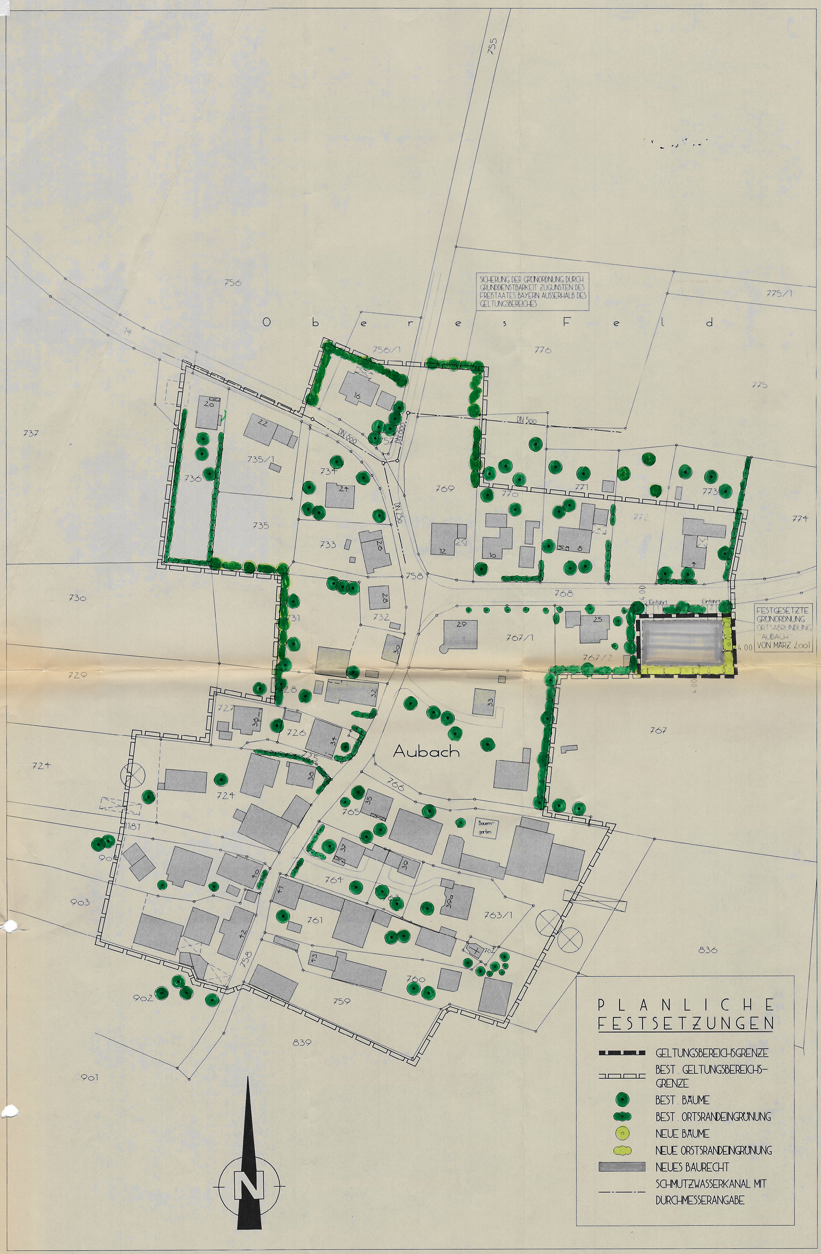
L A G E P L A N M 1:1000