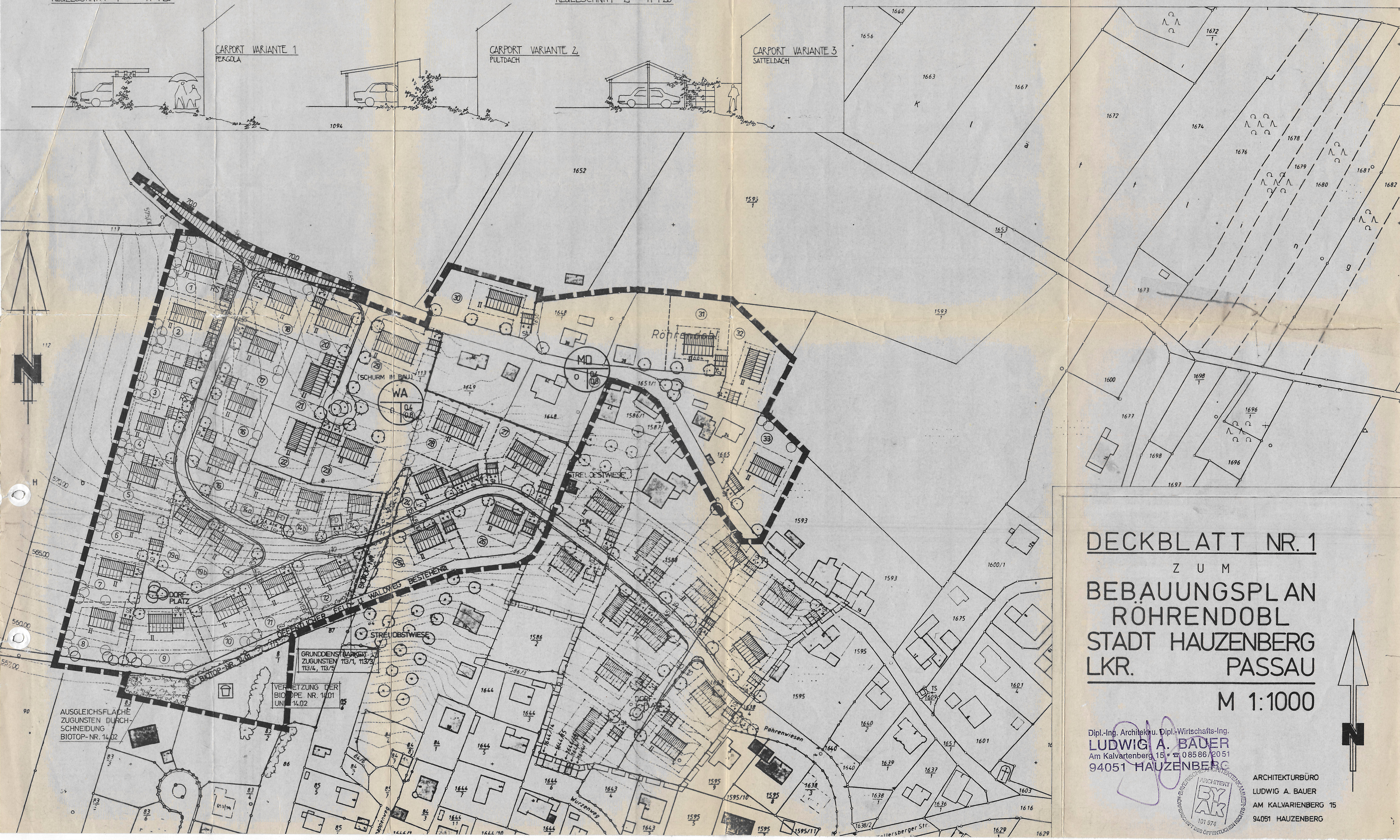
CARPORT VARIANTE 3 SATTELDACH