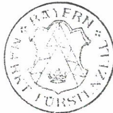
Lehner 1. Bürgermeister

Das Deckblatt wird mit dem Tage der Bekanntmachung gemäß § 10 Abs. 3 BauGB, das ist am 11.12.2007 rechtsverbindlich. Das Deckblatt hat vom 11.12.2007 bis 27.12.2007 im Rathaus Fürstenzell öffentlich ausgelegen. Der Satzungsbeschluss des Deckblattes sowie Ort und Zeit seiner Auslegung wurden ortsüblich durch Anschlag an den Gemeindetafeln am 11.12.2007 bekannt gegeben.