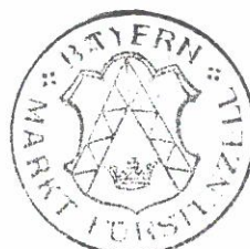
Lehner 1. Bürgermeister