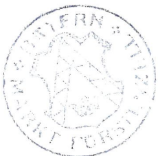
H a m m e r 1. Bürgermeister