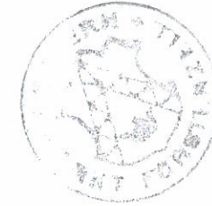
MARKT FÜRSTENZELL 1. Bürgermeister

Der Bebauungsplan wird mit dem Tage der Bekanntmachung gemäß § 10 Abs. 3 BauGB, das ist am 09.02.2006 rechtsverbindlich. Der Bebauungsplan hat vom 09.02.2006 bis 23.02.2006 im Rathaus Fürstenzell öffentlich ausgelegen. Der Satzungsbeschluss des Bebauungsplanes sowie Ort und Zeit seiner Auslegung wurden ortsüblich durch Anschlag an den Gemeindetafeln am 09.02.2006 bekannt gegeben.