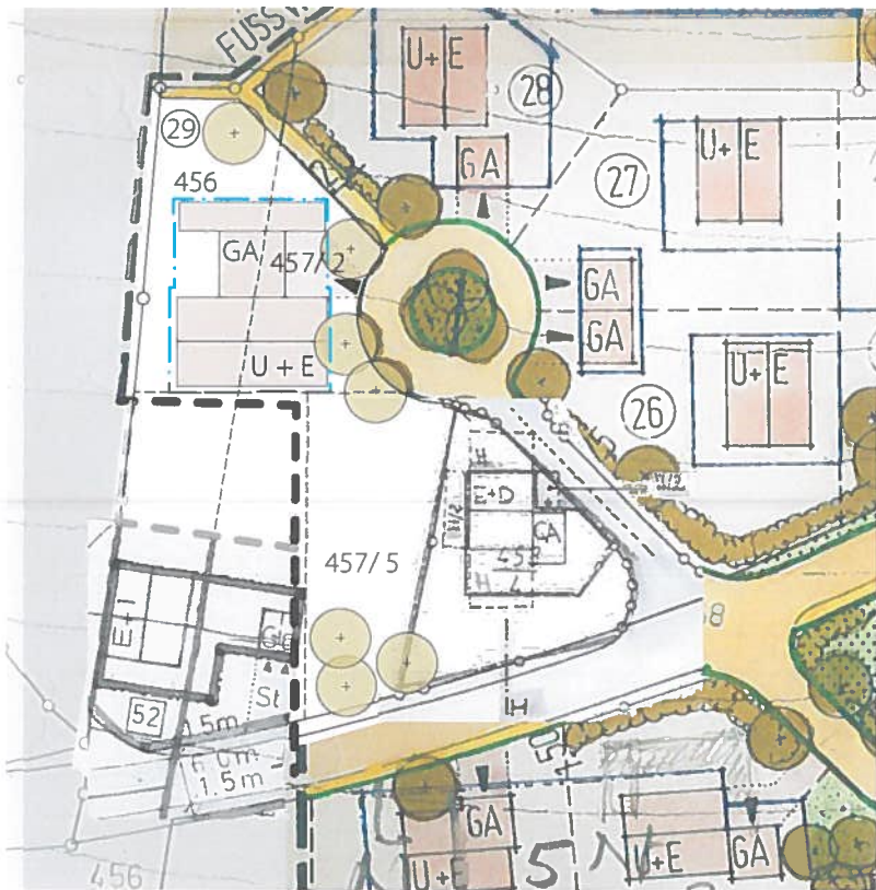
Bebauungsplanausschnitt geplante Änderung M 1:1000