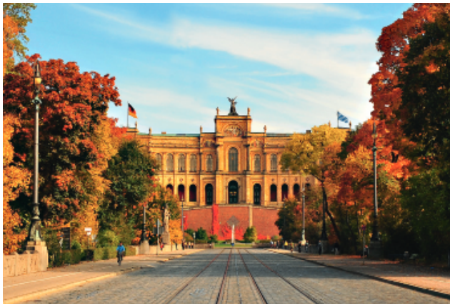
Maximilianeum in München, Sitz des Bayerischen Landtags

Herausgeber: Bayerischer Landtag Landtagsamt Stabsstelle K2 Öffentlichkeitsarbeit Maximilianeum Max-Planck-Straße 1 81675 München Postanschrift: Bayerischer Landtag 81627 München Telefon +49 89 4126-0 Fax +49 89 4126-1392 landtag@bayern.landtag.de www.bayern.landtag.de